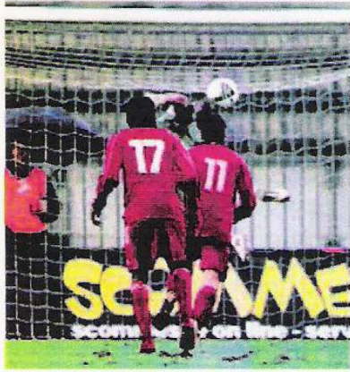
Paoloni in ritardo smanaccia la palla ma non evita il gol

Il portiere grigiorosso al di sotto del suo standard