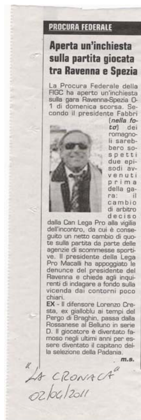
Estratto dal quotidiano locale "CRONACA" del 02.04.2011