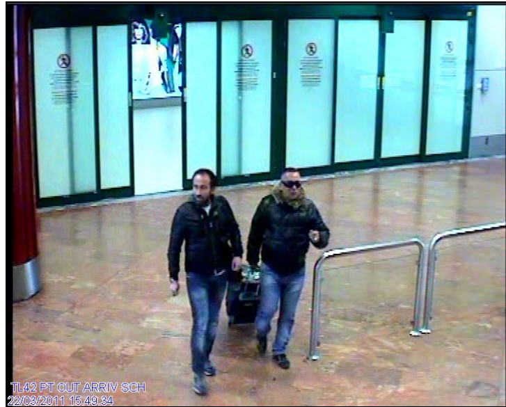
Riscontro estrapolato dal sistema di video sorveglianza a circuito chiuso